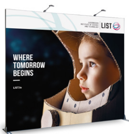
Straight Wall 2950 x 2495 mm*