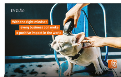
Straight Wall 3950 x 2495 mm